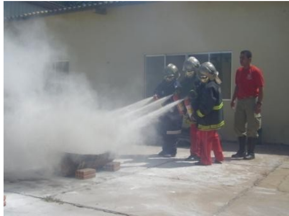
Prevenção e combate a incêndio