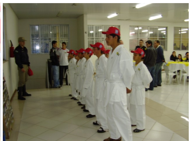
Educação física e artes marciais